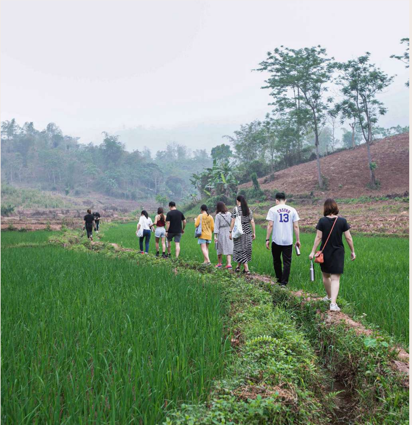
*Cảnh quan thực tế thay đổi theo thời điểm.