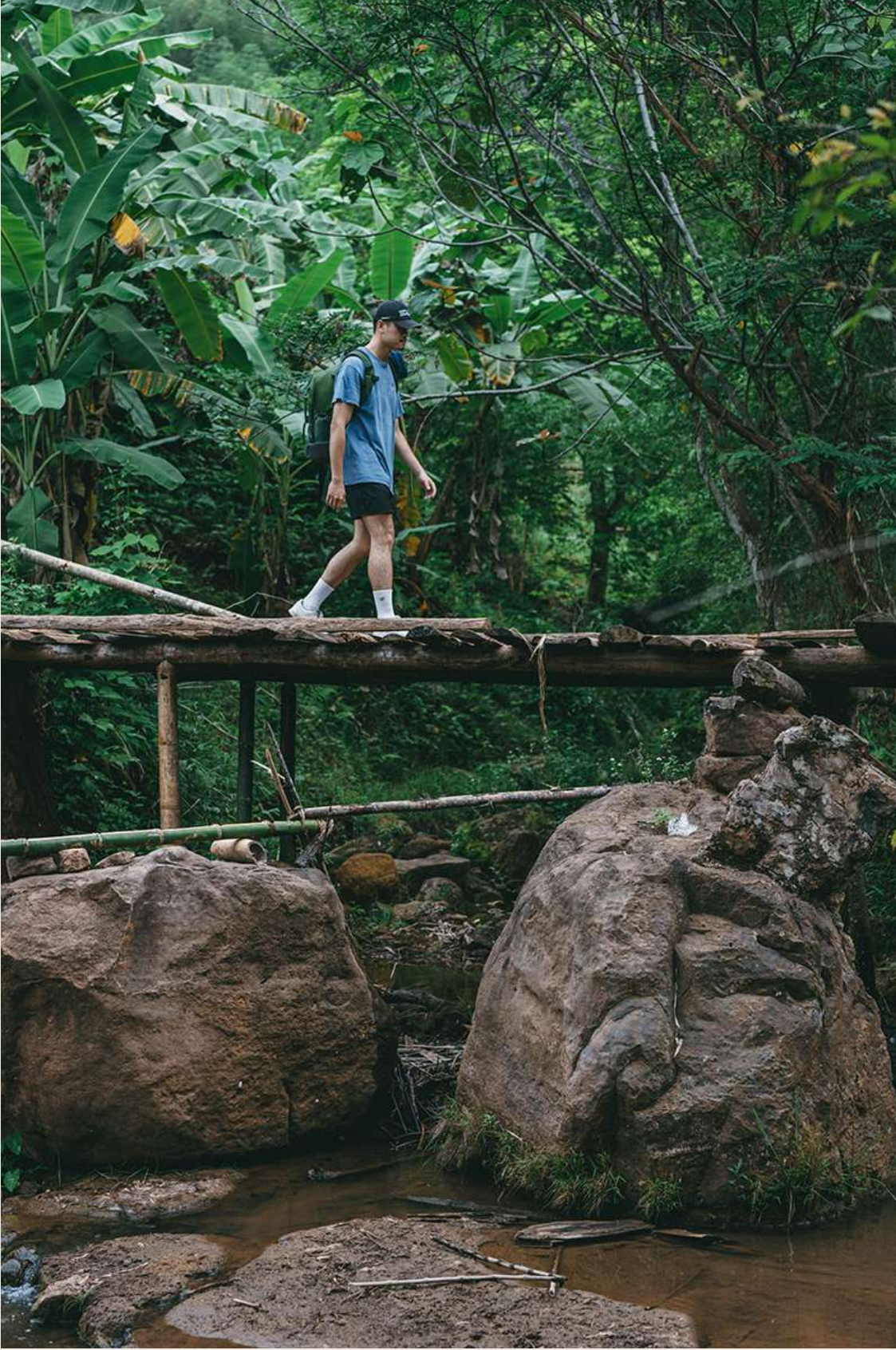
DẠO BƯỚC THÂM BẢN